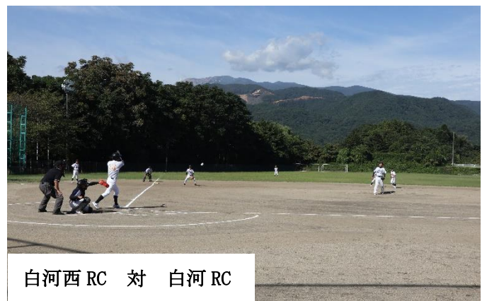
白河西 RC 対 白河 RC