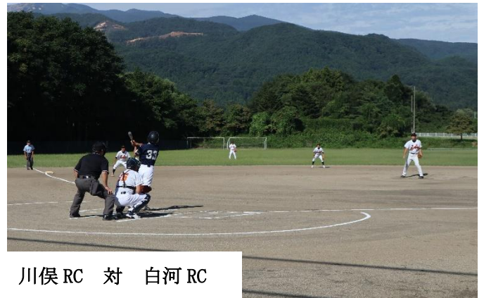
川俣 RC 対 白河 RC