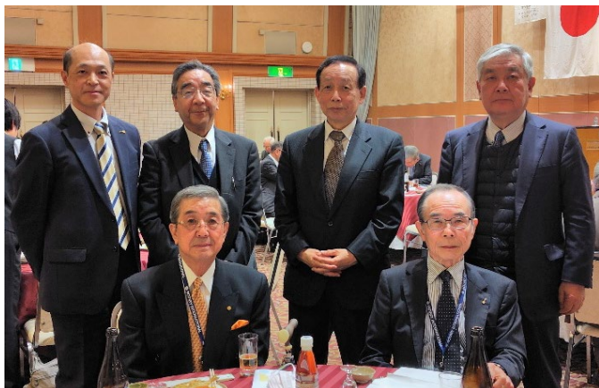
◇米山記念奨学生あいさつ